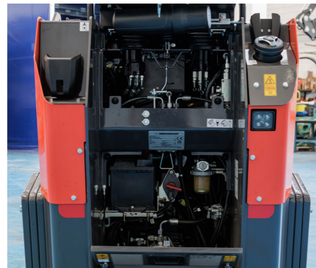
Accesso posteriore a batteria e pompa.