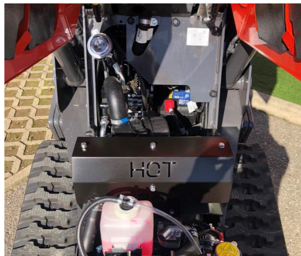
Accesso anteriore al motore e ai filtri aria e carburante.

I quattro punti di fissaggio (2 in posizione anteriore e 2 in posizione posteriore) facilitano il trasporto in sicurezza della macchina su qualsiasi tipo di mezzo.