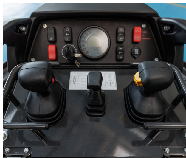
Cosole di comando con joystick idraulici pilotati.

Tutte le attrezzature si attivano grazie ai comandi elettrici ed idraulici presenti nella console di comando (roller AUX 1 e pulsanti opzionali) La barra a LED anteriore può essere attivata con uno scatto dal pulsante dedicato, mentre per attivare la posteriore sono necessari due scatti. Entrambe garantiscono visibilità fino a 25 m.